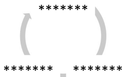
Рис.1. Название рисунка